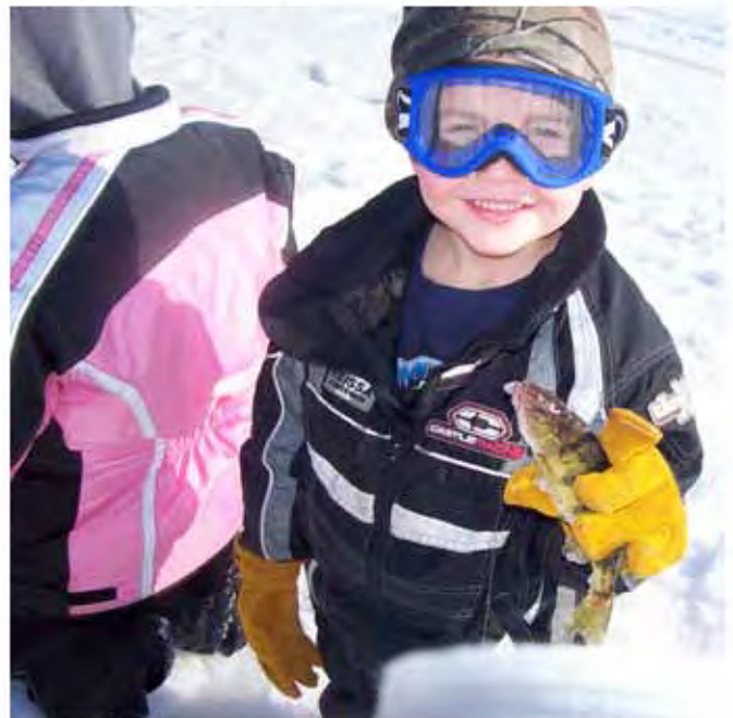
Cortesía de Julie Molacek

La primera mañana de la actividad de investigación, los niños de la clase de Nette descubrieron pececillos, renacuajos y camarones en la mesa de exploración sensorial.