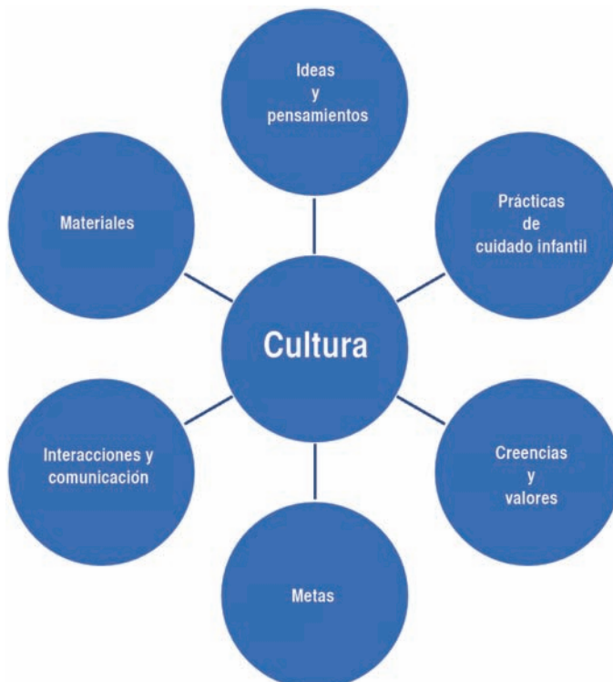
Figura 2. Conexiones a la cultura.