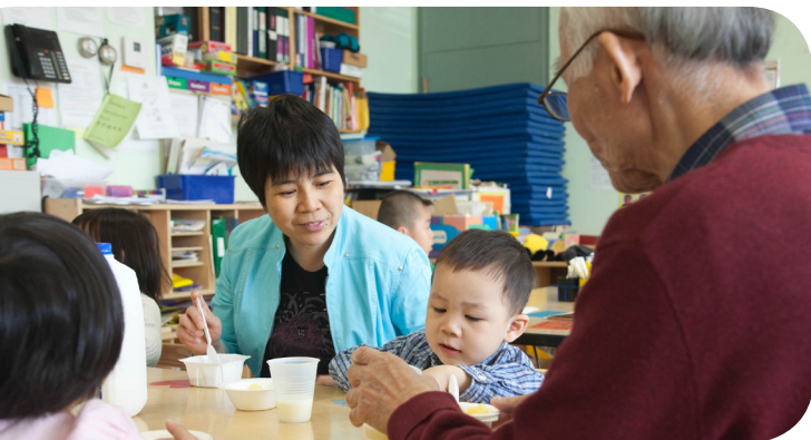
Serie de la investigación a la práctica

Ayudar a los demás es otra manera de ayudar a fortalecer relaciones entre las personas y fomentar la seguridad en sí mismos. Un beneficio importante del capital social es la ayuda que los miembros se ofrecen entre sí. Head Start y Early Head Start pueden crear oportunidades para que los padres colaboren los unos con los otros de maneras básicas. Cuando las familias se encuentran en una etapa de transición y tienen necesidades concretas, otras personas pueden ayudar cocinando una de las comidas u ofreciéndose a cuidar a los niños. La escuela pública The Hilltown Cooperative Charter Public School en Haydenville, MA, ha creado un sistema de compañeros para ayudar a las nuevas familias a integrarse a la escuela. El programa conecta a las nuevas familias con familias que tienen ya más experiencia en el programa. Esto permite que las familias más experimentadas puedan compartir sus conocimientos prácticos ayudando a otros, y esto crea una conexión para que estos "compañeros" puedan recurrir el uno al otro en busca de ayuda en el futuro. Muchos de los programas de Head Start tienen programas de padres embajadores que funcionan de la misma manera.